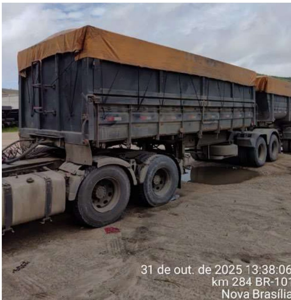
31 de out. de 2025 13:38:06 km 284 BR-101 Nova Brasília