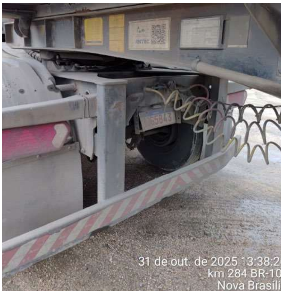
31 de out. de 2025 13:38:26 km 284 BR-101 Nova Brasília