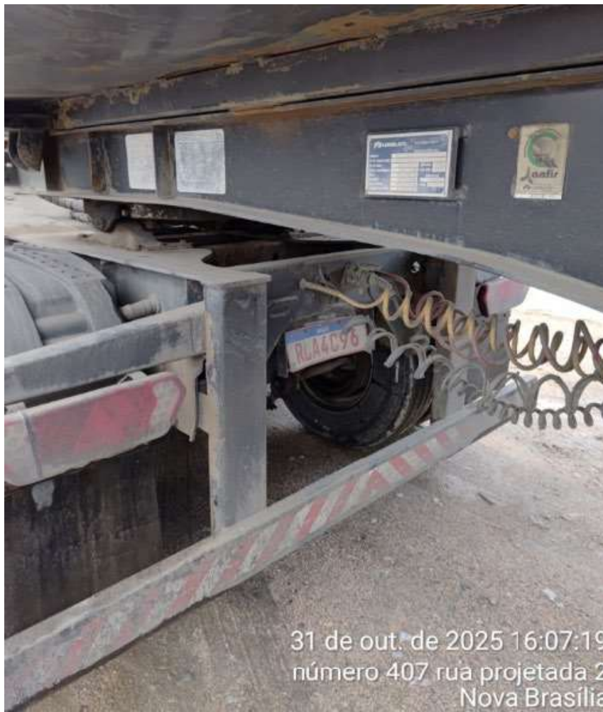
31 de out. de 2025 16:07:19 número 407 rua projetada 2 Nova Brasília