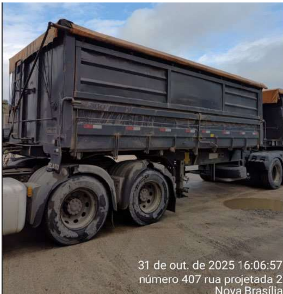
31 de out. de 2025 16:06:57 número 407 rua projetada 2 Nova Brasília