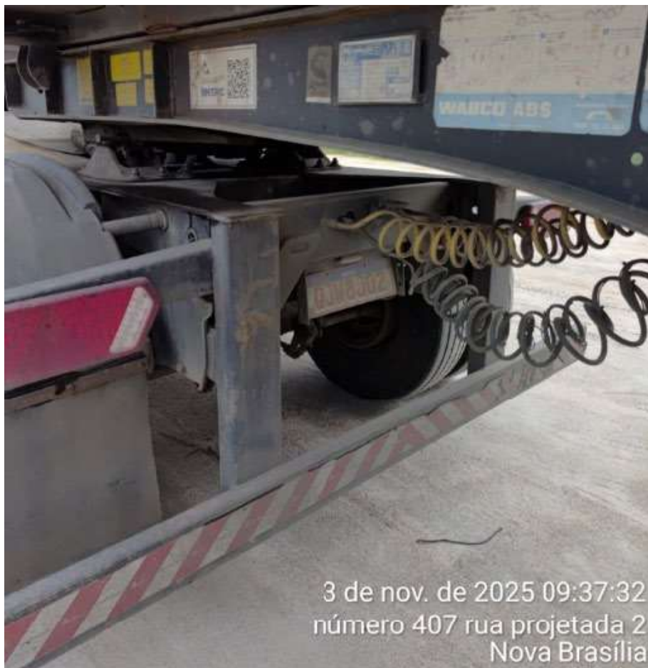
3 de nov. de 2025 09:37:32 número 407 rua projetada 2 Nova Brasília