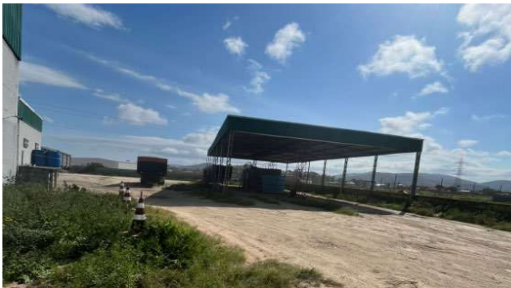
Localização da estrutura física do grupo.