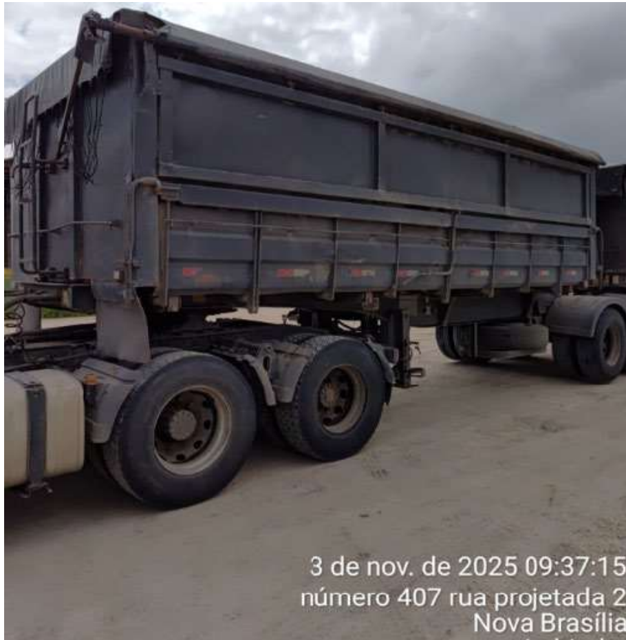
3 de nov. de 2025 09:37:15 número 407 rua projetada 2 Nova Brasília